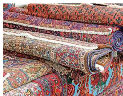
Teppiche halten bedeutend länger dank guter Pflege.

Service Zentrum Schulz Schaffhauserstrasse 111 8400 Winterthur Tel. 052 520 62 68 www.service-zentrum-schulz.ch