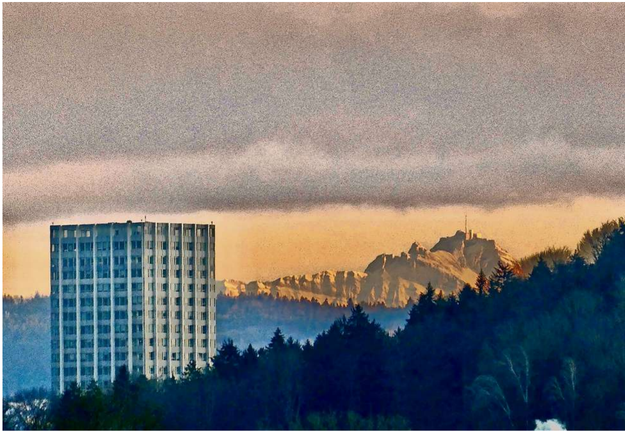
Bild der Woche Leserin Margrit Schoch aus Winterthur hat dieses Bild am 11. Januar in der Hard in Winterthur aufgenommen. Sie schreibt dazu: «Wenn man das Gefühl hat, dass der Säntis gleich hinter dem Sulzerhochhaus steht...»

Haben auch Sie ein besonderes Foto aus Winterthur? Dann senden Sie uns dieses mit Angaben zum Sujet. Foto an: gewinn@winterthurer-zeitung.ch