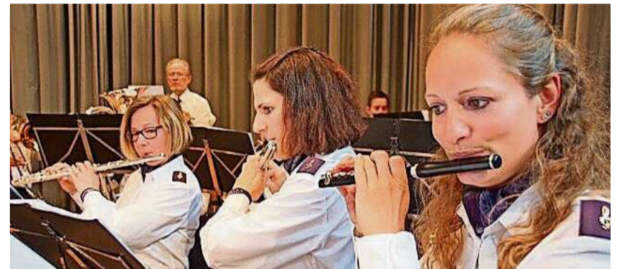
Die Musikgesellschaft Edelweiss Wülflingen.